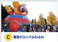
C 東京ドロンパふわふわ