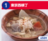
1 東京西横丁 豚もつ煮 650円