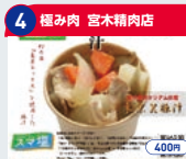
4 極み肉 宮木精肉店 東京X果汁 400円