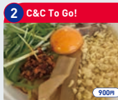
2 C&C To Go! 油そば 900円