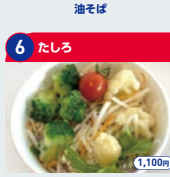
6 たしろ サラダまぜそば 1,100円