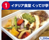
1 イタリア食堂 かってけ亭 1,200円