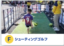
F シューティングゴルフ