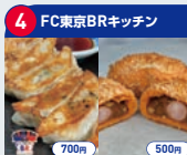
4 FC東京BRキッチン FC東京X餃子 (左) FC東京WINNERカレーパン (右) 700円 (餃子) / 500円 (カレーパン)