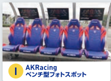
I AKRacing ベンチ型フォトスポット