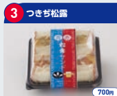
3 つきぎ松露 700円