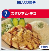
7 スタジアム・デコ 海南鶏飯 950円