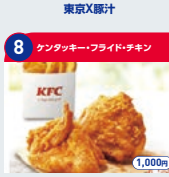
8 キンダーキック・フライドチキン チキンポテトセット 1,000円