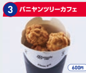
3 パニヤッツリーカフェ 揚げえび団子 600円