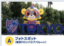
A フォトスポット (東京ドロンパフェアゾーン)