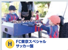
H FC東京スペシャル サッカー鑑