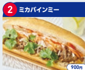
2 ミカバインミー 900円