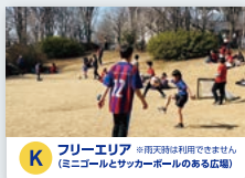
K フリーエリア ※雨天時は利用できません (ミニゴールとサッカーボールのある広場)