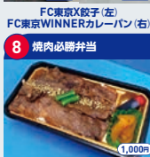
8 焼肉必勝弁当 焼肉必勝弁当 1,000円