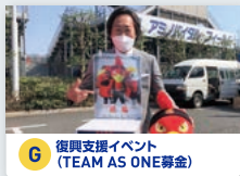
G 復興支援イベント (TEAM AS ONE募金)