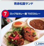
7 ロックなカレー屋 YASSカレー YASSカレー 1,200円