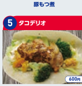
5 タコデリオ ハーブチキンのペジタコス 600円